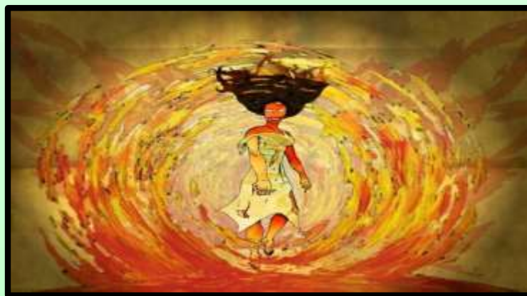
Figura 1. Diagramación de la Historia de la Tradición Oral Venezolana “Bola E’

El instrumento aplicado fue un cuestionario estructurado por bloques: el primero consideró la recolección de datos sociodemográficos; el segundo, lo respectivo a medición de conocimientos sobre la noción de patrimonio cultural intangible y tradición oral venezolana, basado en preguntas cerradas, estrictamente dicotómicas (dos posibilidades de respuesta). Y el tercero, en la valoración de las variables antes mencionadas, a partir de la selección entre varias opciones de respuesta, utilizando la escala de medición del 1 al 5 para soportar los resultados del análisis. Éste fue aplicado en dos oportunidades, una primera para la fase diagnóstica, y una segunda para verificar el impacto de la herramienta didáctica en el proceso de enseñanza-aprendizaje. La validación del cuestionario se realizó mediante la técnica de juicio de expertos en torno al grado de correspondencia de los objetivos de la investigación con los ítems de los instrumentos, en cuanto a su contenido y construcción, así como a su congruencia y claridad, atendiendo a las observaciones en cuanto a la pertinencia de las dimensiones, indicadores y redacción.