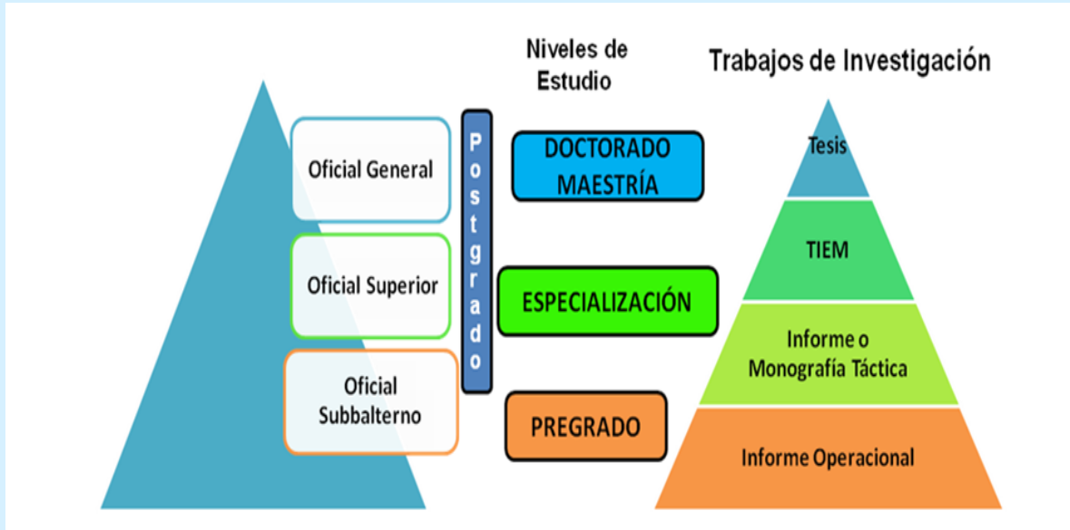
Figura 3. La investigación como continuo doctrinal estratégico de UMBV.