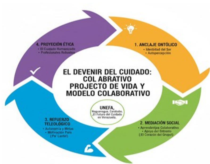
Figura 1: Flujo Lógico de la Investigación

actuales, justificando la pertinencia de un modelo que asegure profesionales robustos y éticos. En suma, los precedentes confirman una brecha conceptual en la literatura: si bien se reconoce la importancia del PVP y la efectividad del aprendizaje colaborativo, no existen trabajos recientes que teoricen de manera explícita y ontológica la vinculación sistémica entre ambos en la formación de enfermeros.