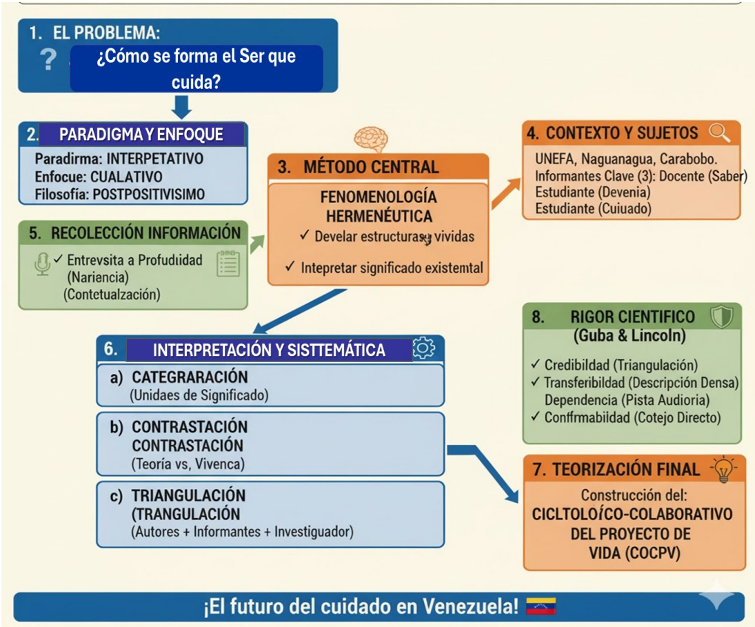
Figura 2: Recorrido Metodológico

por su riqueza informativa. La recolección de datos se basó principalmente en la Entrevista a Profundidad para capturar la narrativa densa y se complementó con la Observación Participante para contextualizar la dinámica del aprendizaje colaborativo.